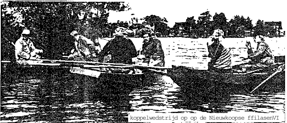
koppelwedstrijd op op de Nieuwkoopse ffilasenVI

De steeds hogere eisen, die de huidige samenleving aan alles stelt, hebben er toe bijgedragen, dat de vereniging de gehele administratie, zoals uitslagenlijsten, ledenlijsten, etiketten, kontributie via een externe personal computer laat verwerken. Leuk is ook, dat een aantal leden de naam van de vereniging al gedurende enkele jaren op een andere wijze uitdraagt. Namelijk door middel van zaalvoetbal.